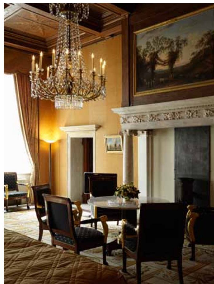
De schouwpartijen en cassetteplafonds zijn beeldbepalend in de monumentale vertrekken.