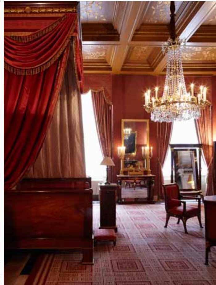
In zijn atelier vervaardigde Piepers alle gordijnen en de twee belangrijkste hemelbedden.