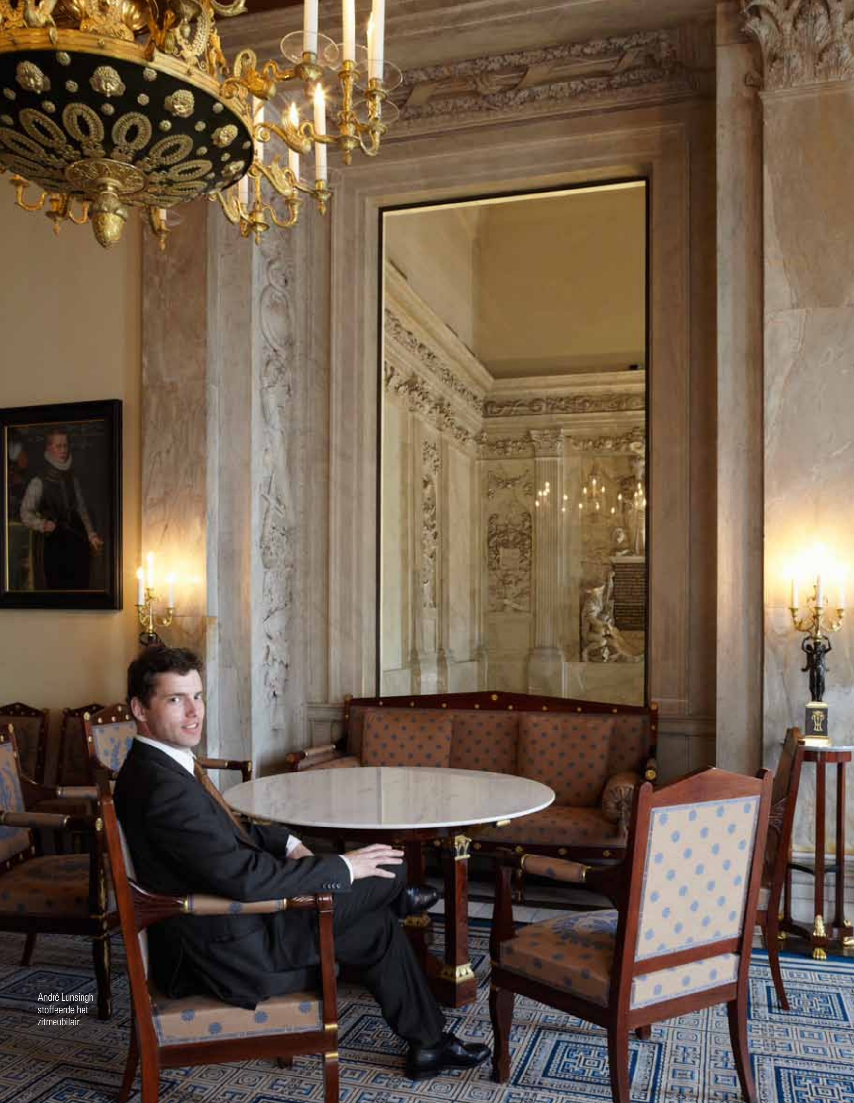
André Lunsingh stoffeerde het zitmeubilair.