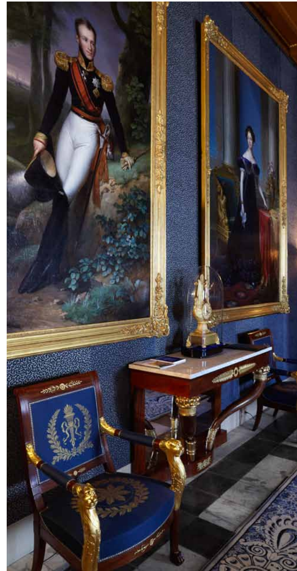
De wandbekleding sluit aan bij de zeventiende eeuw met typische patronen uit die tijd.

Zomertentoonstelling: tot en met 18 september staan de werken van belangrijke Hollandse meesters centraal tijdens de expositie 'Opstand als Opdracht', die het Paleis op de Dam binnen de paleismuren organiseert.