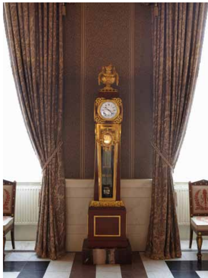
Een van de pronkstukken in het Burgemeestersvertrek.

schilderingen. En of dat allemaal nog niet genoeg was, vroeg hij de Antwerpse beeldhouwer Artus Quellinus om van het gebouw één grote mythologische voorstelling te maken, ontworpen uit marmer en steen. Ook Atlas die in de Burgerzaal de wereld op zijn schouders torst is van zijn hand. Hij kijkt neer op de wereldzeeën en het heelal, die verwerkt zijn in de vloer. De Amsterdamse burgers doorkruisten dus al wandelend door het stadhuis als het ware de wereld, zoals handelslieden dat ook deden in de zeventiende eeuw.